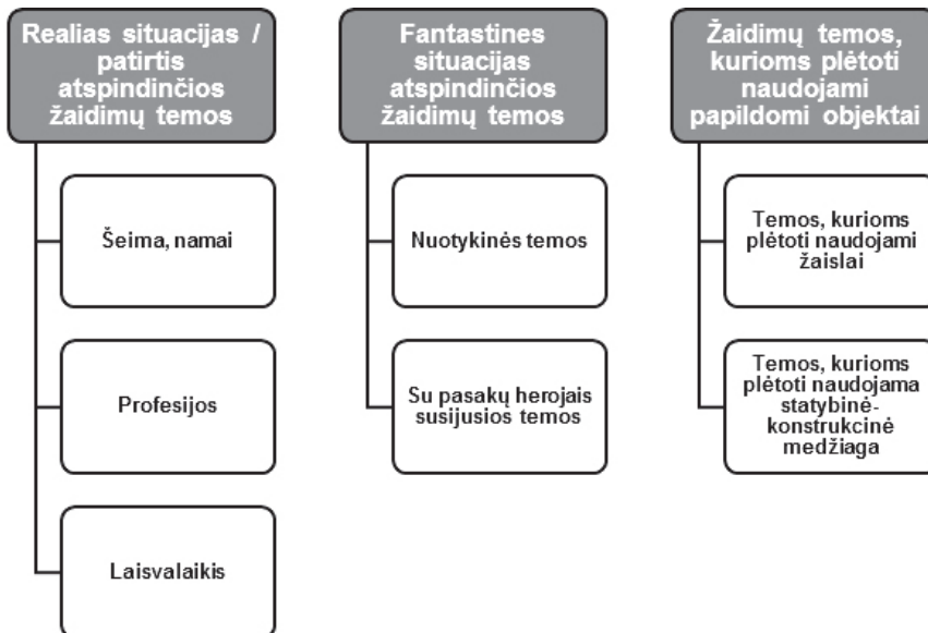
2 pav. Vaikų žaidimų temų kategorijos ir subkategorijos

Žaidimų temos. Kaip jau buvo minėta, remiantis auklėtojų išvardytomis vaikų žaidimų temomis, atlikta detalesnė jų analizė. Ją atliekant išskirti du kategorijų ir subkategorijų lygmenys: pirmąjį lygmenį sudaro 3 kategorijos, o jas (antrąjį lygmenį) – 7 subkategorijos. Kategorijų ir subkategorijų lygmenys pavaizduoti 2 pav.